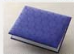
越前和紙 紫洗 1,858円