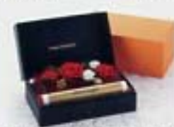
フリーズドフラワーBOX(レッド) 3,696円