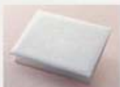
プレミアム・ホワイト 1,953円