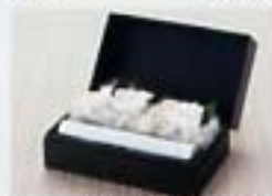
フリーズドフラワーBOX(白) 3,696円