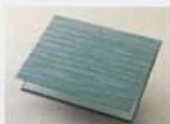
越前和紙 翠雅 1,575円