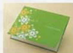
ブロンマ(グリーン) 1,260円